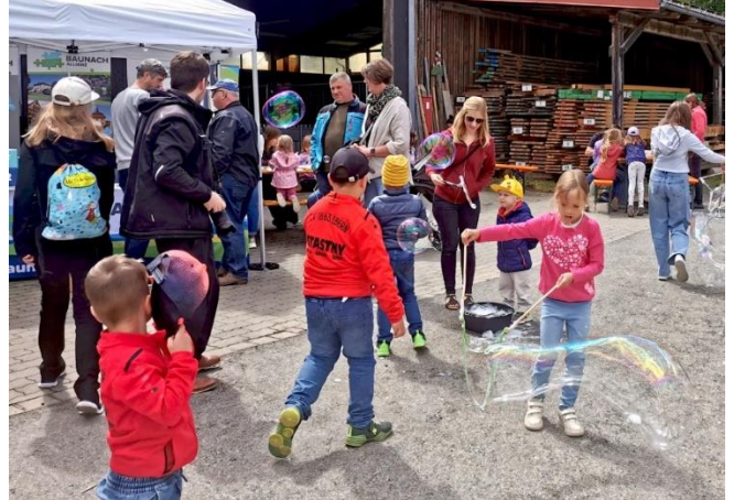
Informationsstand –Tag der offenen Tür – Bauhof Ebern

Beispielhafte Belegexemplare zur Öffentlichkeitsarbeit finden sich im Anhang.