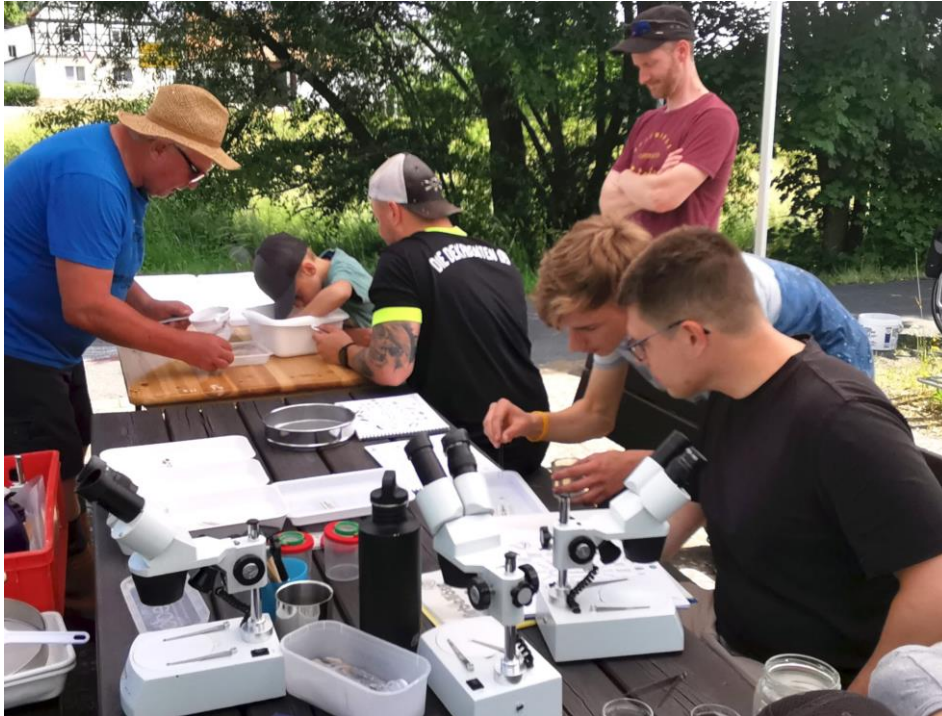
Wissenschaft zum Anfassen - Flow Tag in der Baunach-Allianz

Beim Apfelfest war die Baunach-Allianz mit einem Mitmachstand vertreten. Im Mittelpunkt standen Informationen zur regionalen Streuobstvielfalt und zur Bedeutung von Biodiversität.