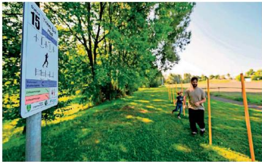
Idyllisch gelegen unter Bäumen am Bach: eine Station des neuen Trimm-Dich-Pfades am Sportplatz in Memmeldorf.

Rund ein Jahr später ist es so auch in Untermerzbach so weit. Entstanden ist ein Trimm-Dich-Pfad, der möglichst viele Muskelgruppen anspricht und die motorischen Grundeigenschaften fördern soll, die jeder