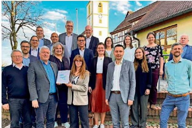
Die Bürgermeister der elf ILE-Gemeinden der „Baunach-Allianz“.

Umsetzungsbegleiter Felix Henneberger stellte dann die „Baunach-Allianz“ vor: bestehend aus elf Kommunen aus den Landkreisen Bamberg, Haßberge und Coburg, die sich auf die zwei Regierungsbezirke Unterfranken und Oberfranken verteilen. Die Allianz ist 2018 offiziell gegründet worden unter der Zielsetzung „gemeinsam – nachhaltig – vielfältig“ mit einem Entwicklungskonzept